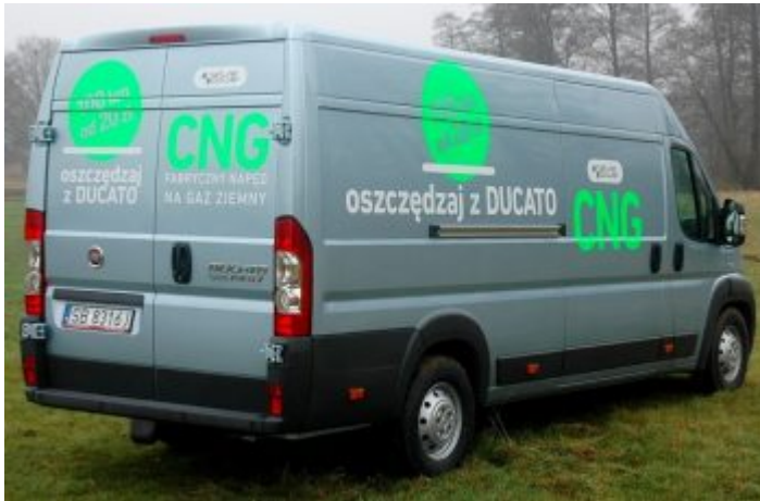
Fiat Ducato op CNG aardgas, compressed natural gas - Euro 6

De Fiat Ducato op CNG, compressed natural gas, bestaat als bestelwagen sinds 2011. Is het een kwestie van tijd tot we deze zien in campermodellen?