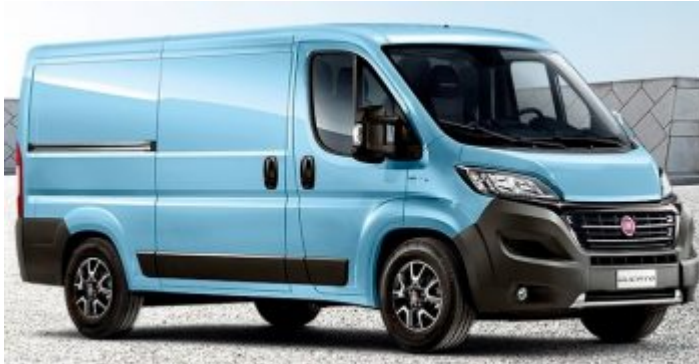
Fiat Ducato op CNG aardgas, compressed natural gas - Euro 6

De Fiat Ducato op CNG, compressed natural gas, bestaat als bestelwagen sinds 2011. Is het een kwestie van tijd tot we deze zien in campermodellen?